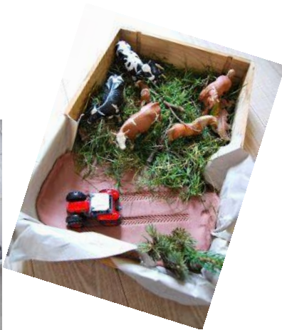
Ici une caisse sur la ferme !