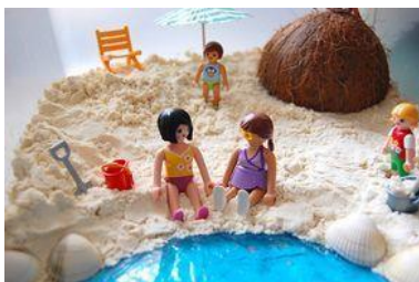
Ici sur la mer, qui serait faisable avec la recette du sable que je vous avais envoyée lundi !

Il y en a énormément sur Pinterest, en cherchant "caisse sensorielle", sur l'hiver, sur le printemps...tout existe, et tout peut être inventé, amusons-nous !